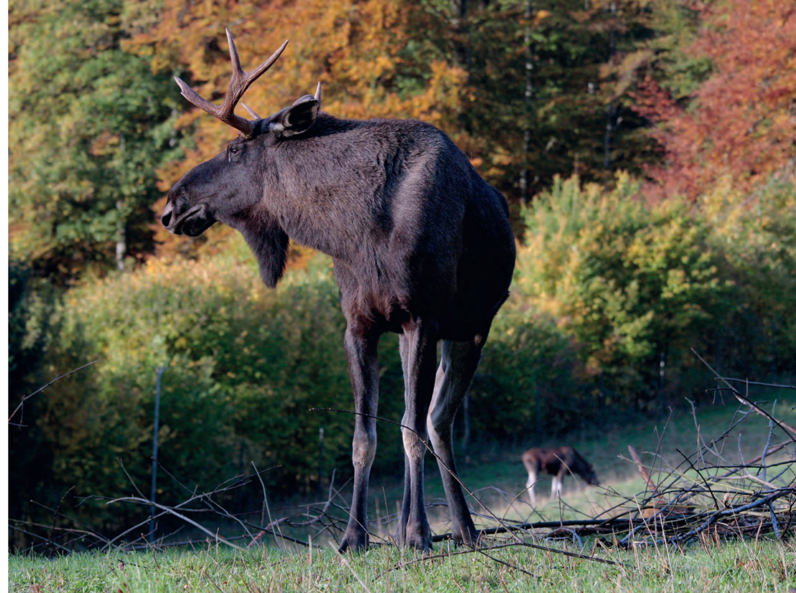
Diese Reportage wurde von Hans Koblet jr. gesponsert.