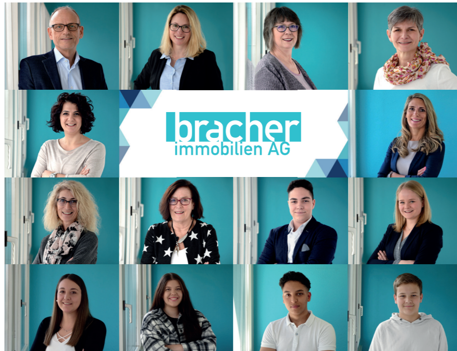
Das kundenorientierte Team der Bracher Immobilien AG.