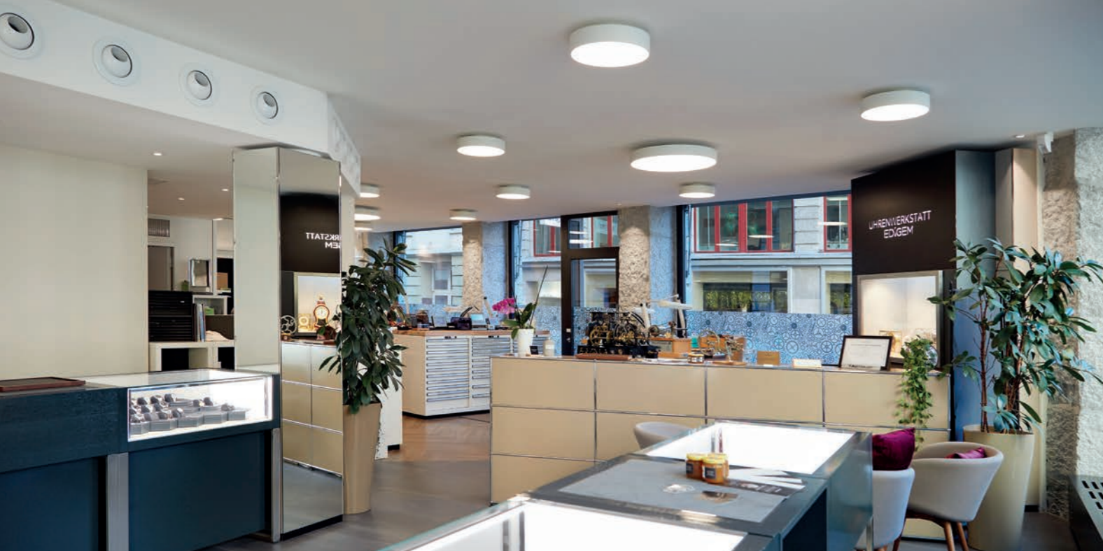
Das Geschäft ist modern und liebevoll gestaltet.