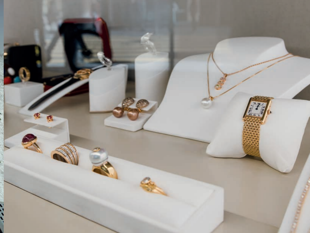
Alle grossen Marken sind hier vertreten.