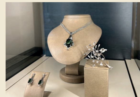
«Pre Owned»: hochwertiger Schmuck aus zweiter Hand

Wir wollen einen Zugang und ein Angebot bieten, wo alle etwas Passendes finden können.